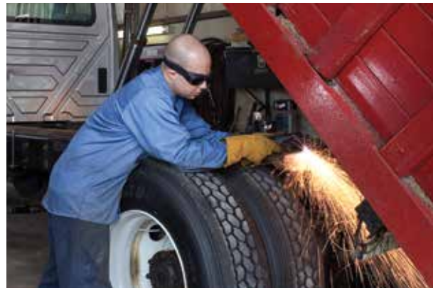
Ремонт и переоборудование машин