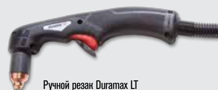
Ручной резак Duramax LT